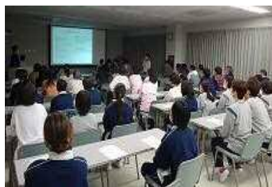
(1 / 2 3 開催)

今年度の事故対策委員会の活動として事故予防マニュアルの見直しを行っています。今回の勉強会では「誤嚥予防マニュアル」について、内容やマニュアルの活用の仕方を説明しました。参加した職員から「事故に繋がる原因が詳しく記載されていて、分かりやすかった」「事故カンファレンスで活用しやすそう」などの意見が挙がりました。利用者様を事故から守るために「リスクに気付いて」対応できるよう、マニュアルの改正・周知を進めて行きたいと思えます。