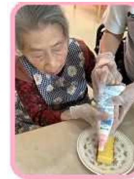
クリームを塗って

おやつにフルーツケーキを作りました。 色とりどりの果物を飾って、美味しくいただきました。 「また作りたい。」と好評でした。