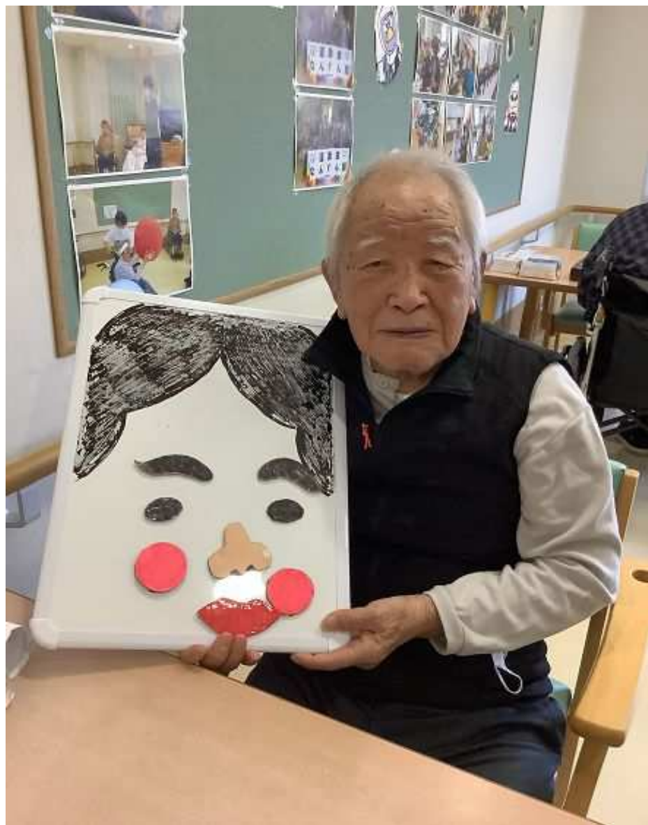
新年会行事で福笑いをしました。 できあがりを見比べて、みんなで大笑いをしました。 「笑う門には福来る」