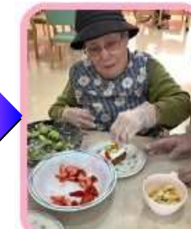
くだものを飾って