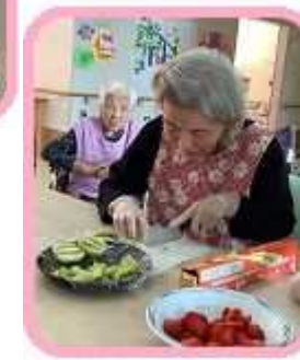
くだものを切って

おやつにフルーツケーキを作りました。 色とりどりの果物を飾って、美味しくいただきました。 「また作りたい。」と好評でした。