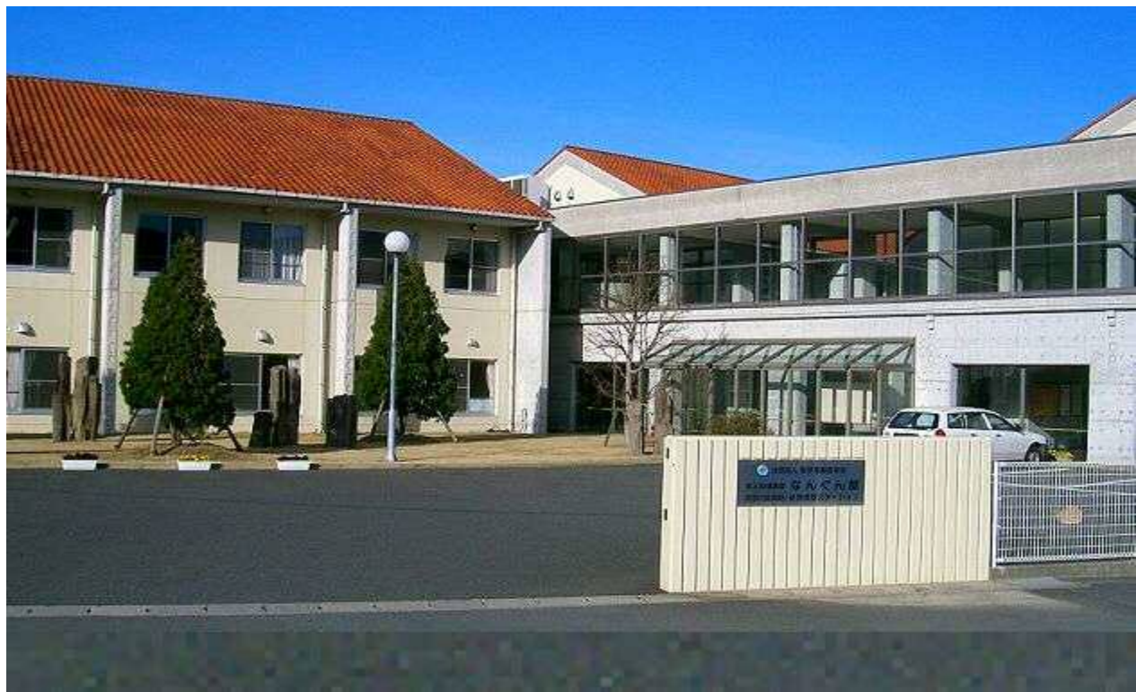
老人保健施設 なんぐん館