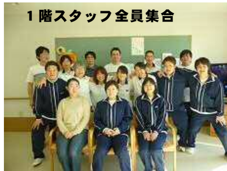
1階スタッフ全員集合