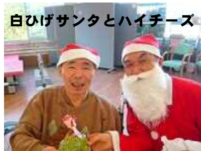
白ひげサンタとハイチース