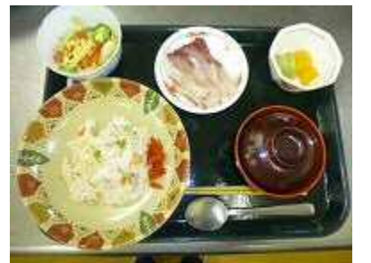
昼食のお刺身になりました