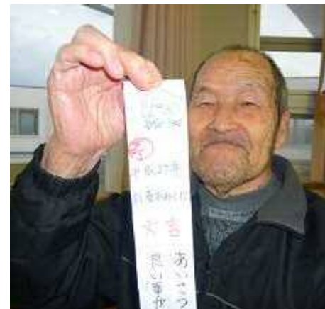
職員手作りのおみくじで、今年の運勢を占いました。結果は大吉かな？

今年も、愛南地区防犯協会様より餅米、愛南漁協魚類養殖協議会様よりお魚をいただきました。お魚は刺身や照り焼きにして、おいしくいただきました。