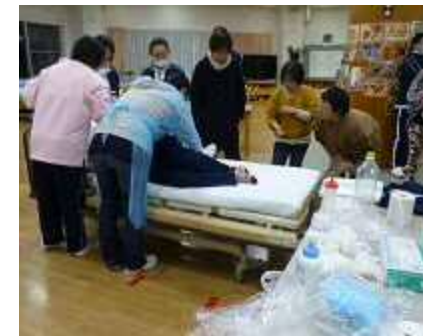
感染症対策勉強会